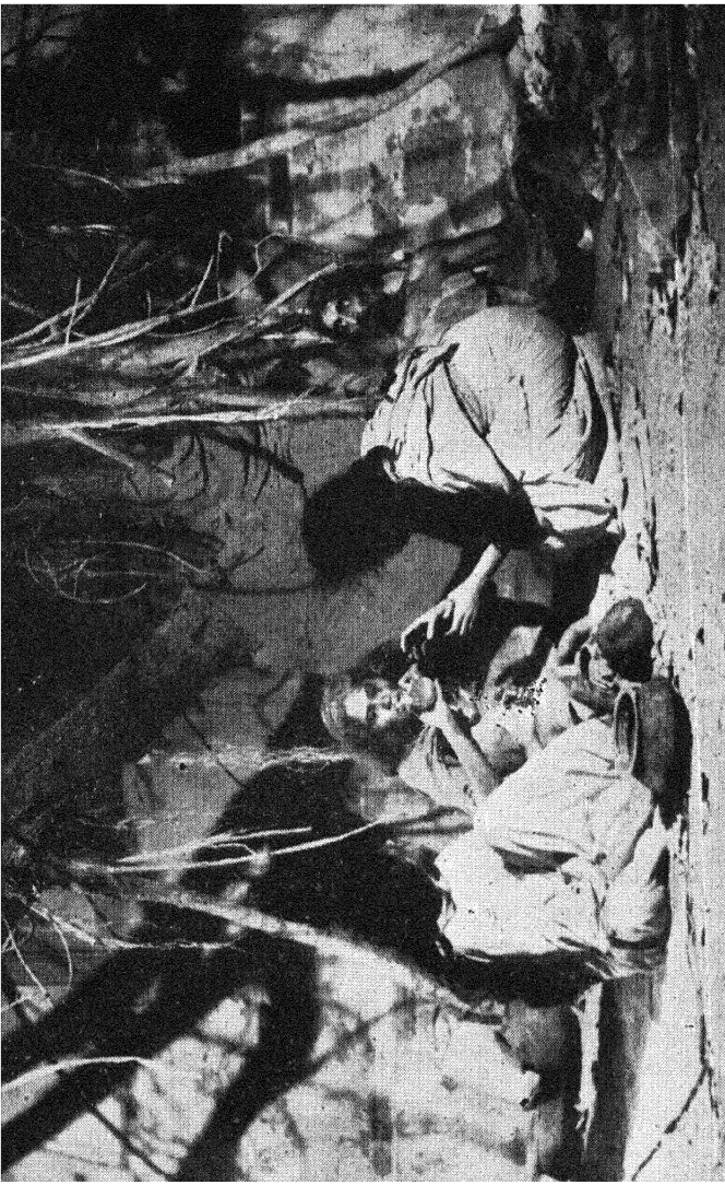
धरतीके लाल: वह अकाल हमारी सङ्कृतिको भी खागया था। शुधासे विक्षित दादी अपने पोतेके दूधकी शीशीपर झपट रही है। [ देखिये पृष्ठ ९४ ]